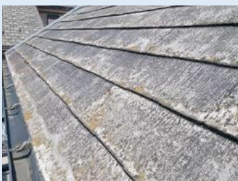
彩色セメント板の劣化