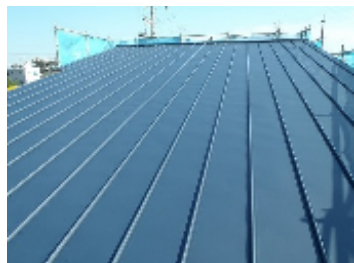
ガルバニウム鋼板