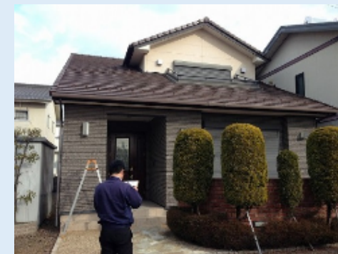
↑IGコンサルティングによる10年点検の様子